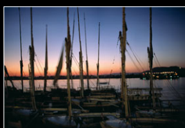
AM NIL von Steffen Hoppe