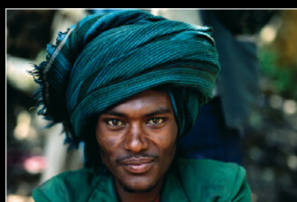
AM NIL Dia-Reportage von Steffen Hoppe Sa., 21. April, 14 Uhr