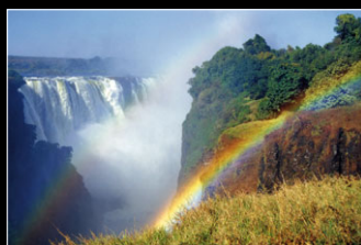
SÜD-AFRIKA 3D-Dia-Show von Stephan Schulz So., 22. April, 11 Uhr