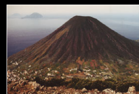
ITALIEN von Oliver Glock