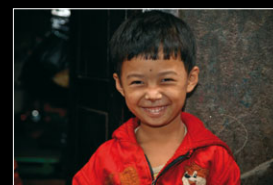
NEPAL von Jürgen Kircher